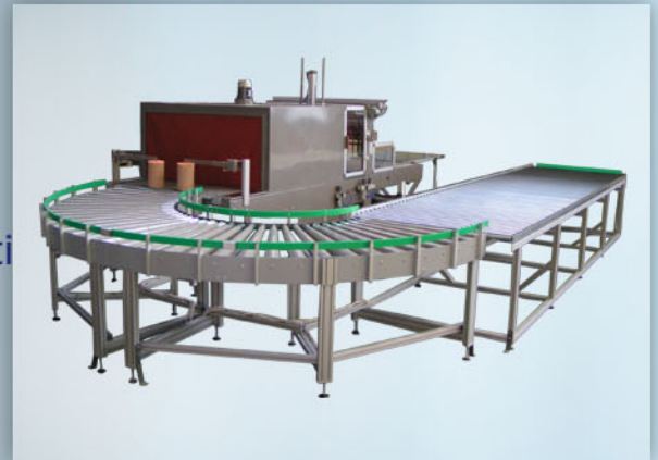
integrace s balicím strojem